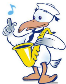
中区マスコット「スウィンギー」